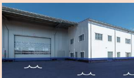
Infrastructure du bâtiment