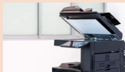
Bureautique et informatique

Au-delà des dommages directs pour l'entreprise, les inondations peuvent aussi engendrer :