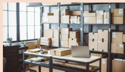
Matériels et stocks